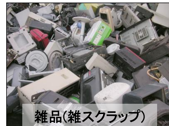
雑品(雑スクラップ)